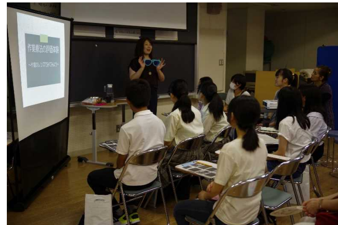
体験コーナー「作業療法の評価技術を体験してみよう」