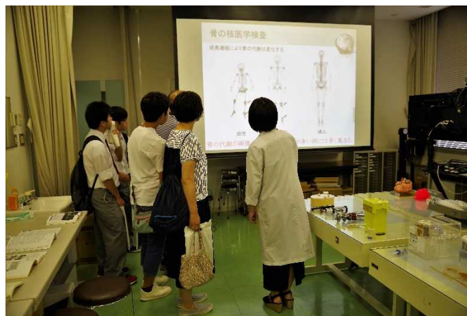
体験コーナー 「核医学」