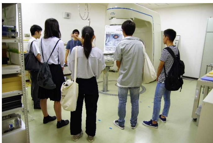
体験コーナー 「放射線治療」