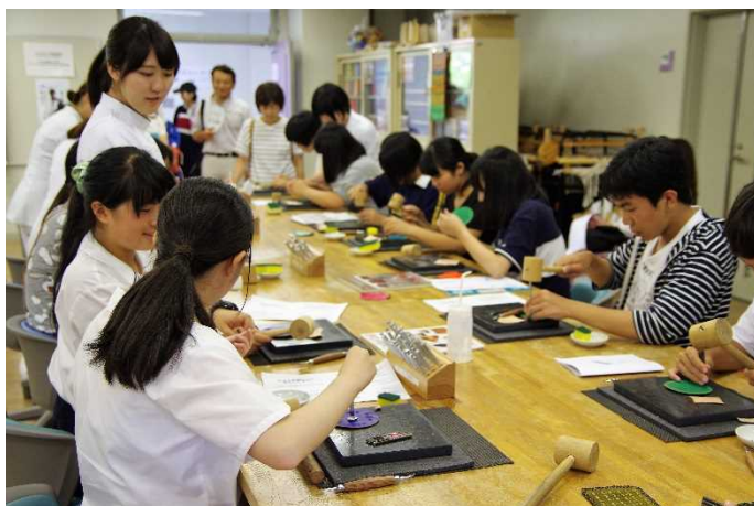
体験コーナー「先輩と一緒に手工芸作品を作ってみよう」