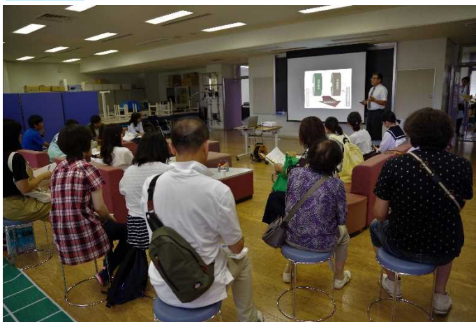
ミニ講義「認知症予防と作業療法士の役割」