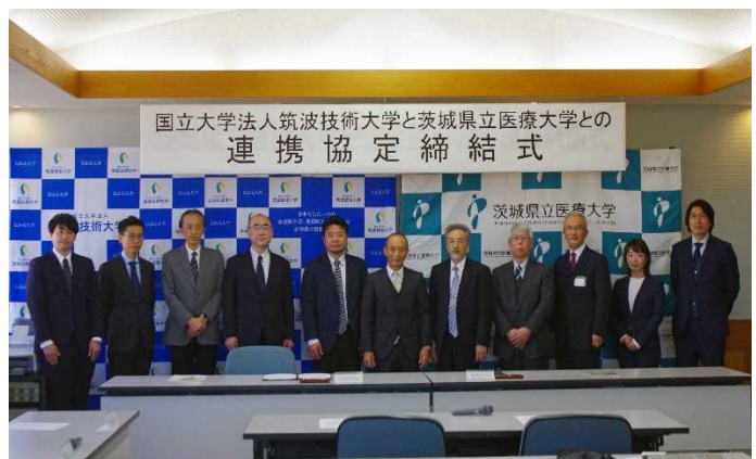
写真4 関係者による協定締結の記念写真