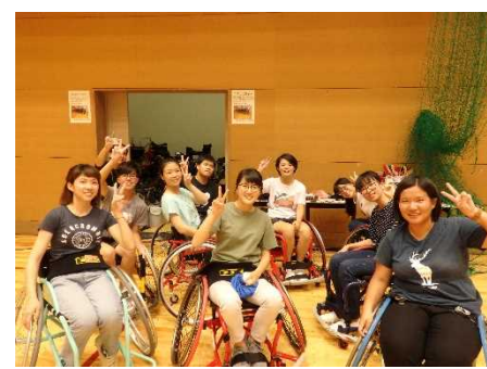
* 車椅子バスケットボールを初体験し、またパスやシュート、練習試合を体験しました。