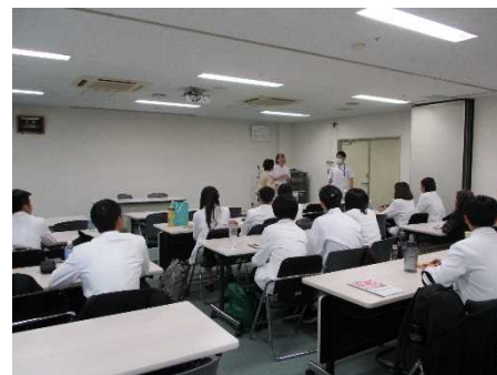
* ドクターヘリの見学