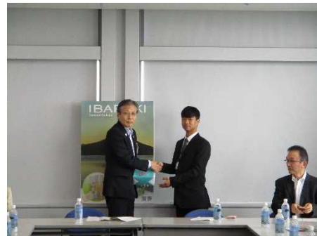
* 小野寺副知事への表敬訪問